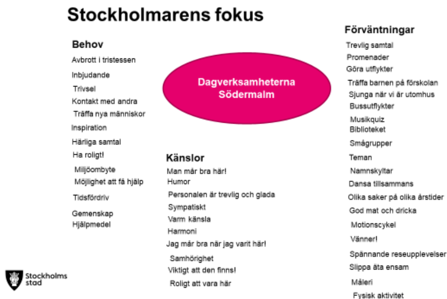
Bild: utdrag från samtal med gäster om förväntningar, behov och känslor.